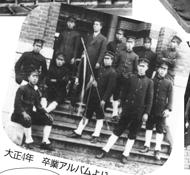
大正4年 卒業アルバムより