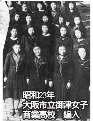
昭和23年 大阪市立御津女子商業高校 編入