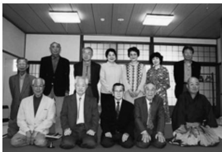
(第37回 辻田 安一 記)