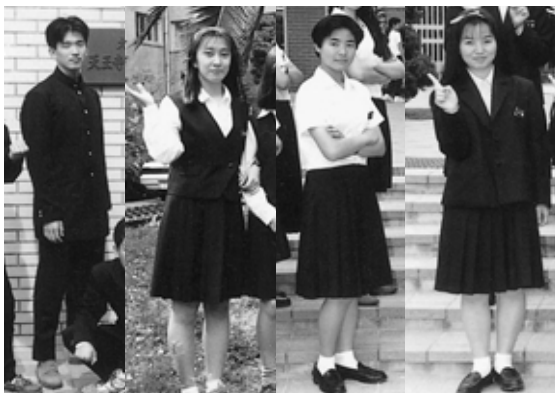
平成5年 卒業アルバムより