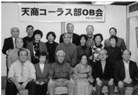
(高17回 美浪 弘子 記)

秋の一夜、学生時代にタイムスリップして、思い出話に花を咲かせ、一同杯を重ね、時の過ぎるのも忘れ、最後に次回の再会を約してお開きとなりました。