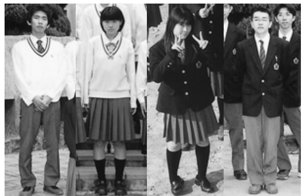
平成12年、13年 卒業アルバムより