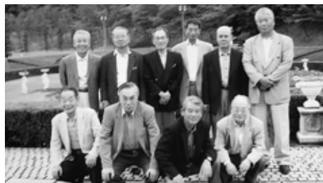
(寺岡 邑憲 記)

平成16年9月26日(日)上六都ホテルで12時 より開催。幹事世話役はA・B組です。