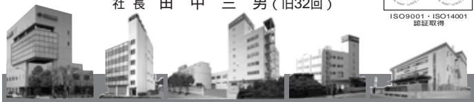
本社 VODセンター 堺第1工場 堺第2工場 物流センター