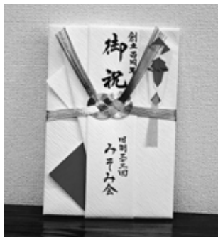
(海堀 真一 記)

6月13日、高校22回同期会にみそみ会幹事4名が招かれ、盛大なることに驚き感服、益々の発展を祈った次第。